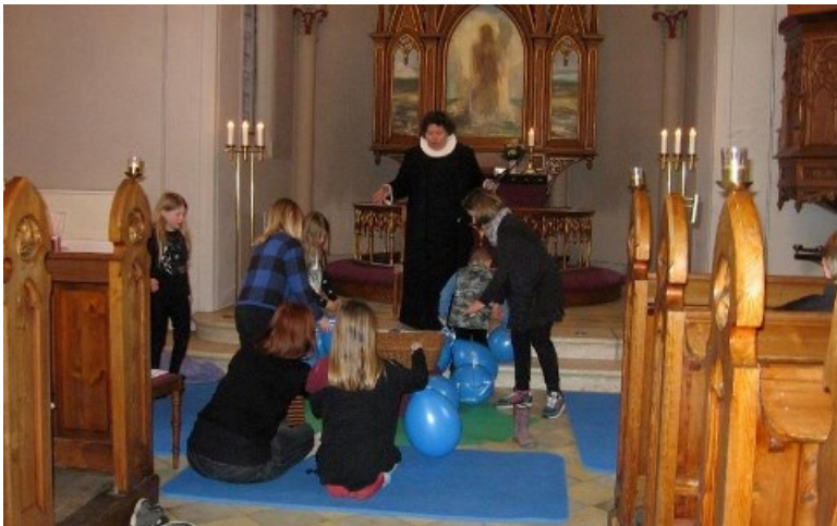
Godnathistorier 14. marts 2016